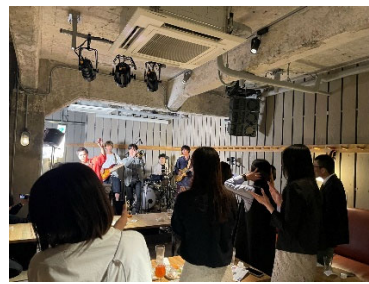
UnderJazz @ B by the Brooklyn Brewery

若手精鋭ミュージシャンが「KABUTO ONE」に集う年に1度の祭典「Jazz EMP」に加え、街の複数店舗で日常的に開催されているジャズ・ライブ。ジャズによって活気づく金融街、日本橋兜町に、是非足をお運びください。