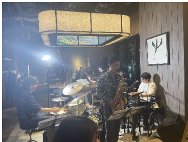
Monday Jazz @ KABEAT

KABUTO ONE の1F のフードダイニング「KABEAT -日本生産者食堂-」では「Monday Jazz@KABEAT」（隔月第2月曜日）を、またホテルK5の地下にある「B by the Brooklyn Brewery」では「UnderJazz@B by the Brooklyn Brewery」（毎月第1火曜日）を、それぞれ開催しており、毎回ご好評いただいています。