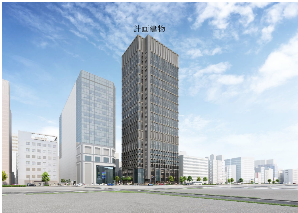
イメージパース 計画地南西方向（永代通り）より望む