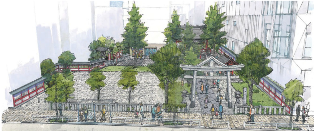
イメージパース（境内地）計画地西方向（平成通り）より望む