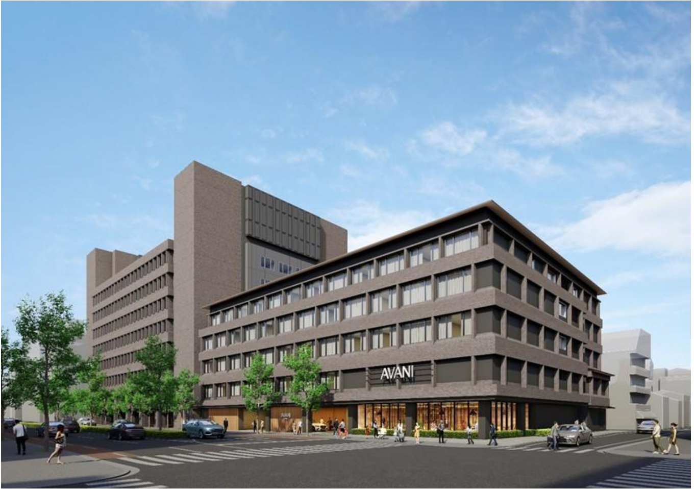
(仮称) Avani Kyoto (アヴァニ京都) の外観

※現時点の外観パースであり、今後の設計ならびに協議等により変更が生じる場合があります。