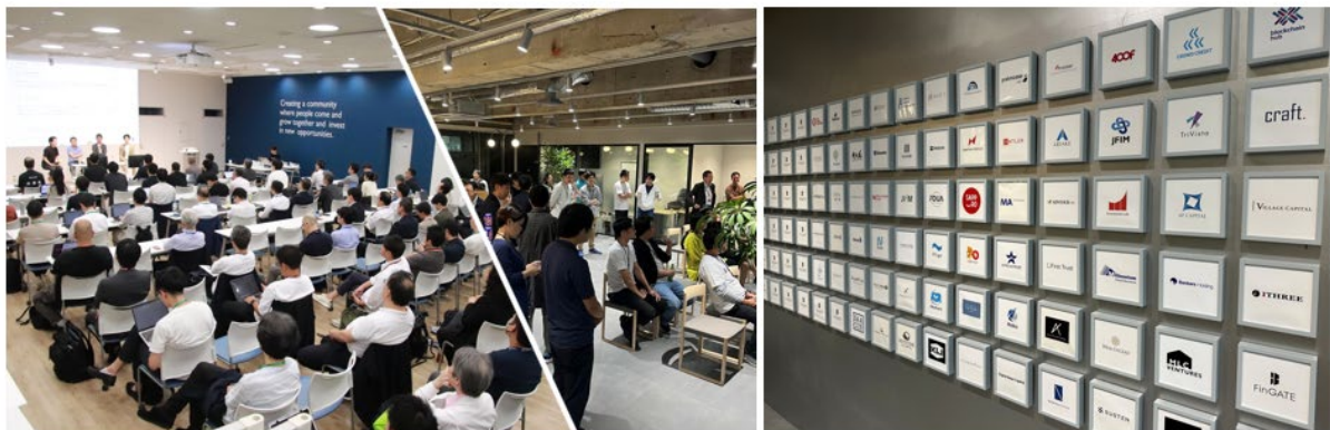
東京日本橋兜町・茅場町「FinGATE」の様子

平和不動産が東京日本橋兜町・茅場町エリアで展開する「FinGATE」は、国内外の独立系資産運用会社やフィンテック等金融系スタートアップの他、VC/PE、金融庁財務局の拠点開設サポートオフィス、国内初の官民連携金融プロモーション組織 FinCity.Tokyo や Fintech 協会等の業界団体など、114社が集積しています。現在、東京では6施設を展開しており、オフィスやイベントスペース等のインフラ整備に加え、情報発信機会の創出、ビジネスマッチング、ミドルバックサービスの導入支援など、入居企業や施設利用者の成長ステージに応じた多面的なサポートを行っています。