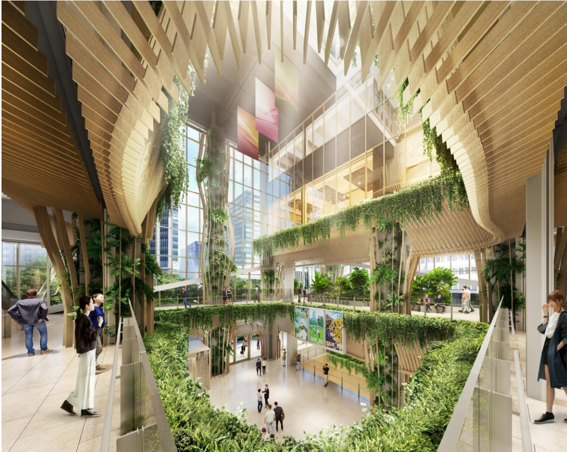
アトリウム内観イメージパース