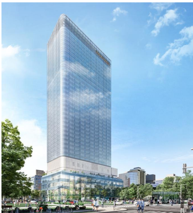
建物外観イメージパース