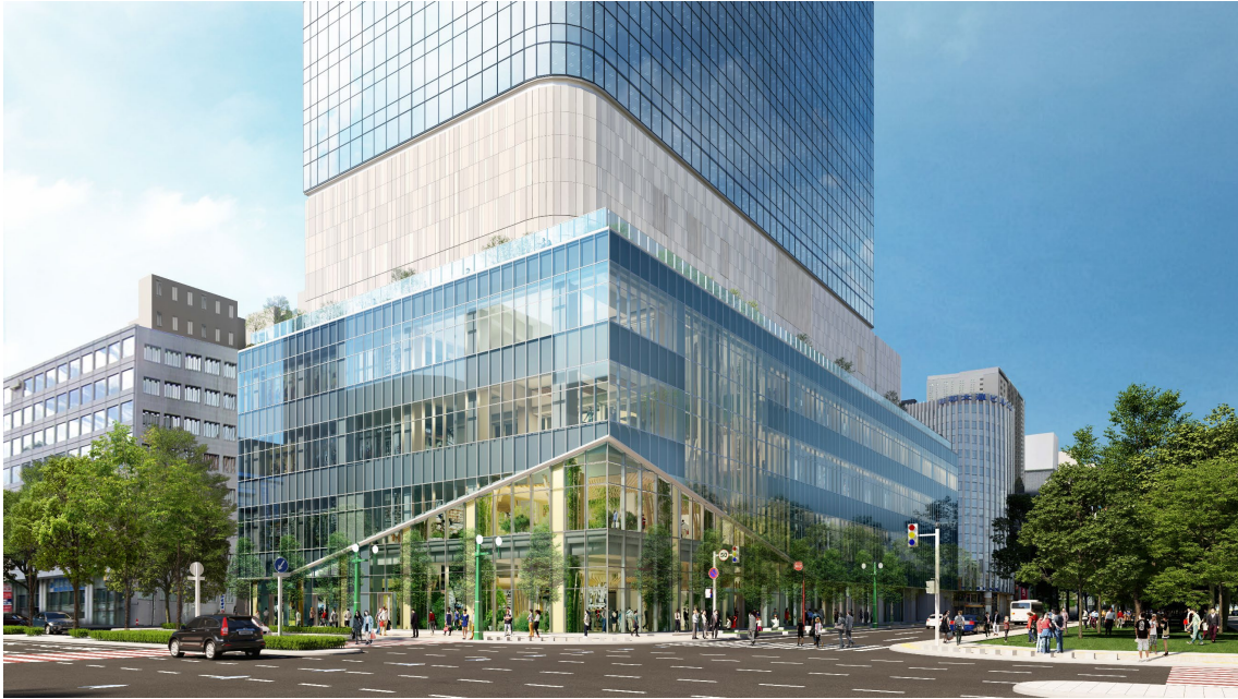
低層外観イメージパース