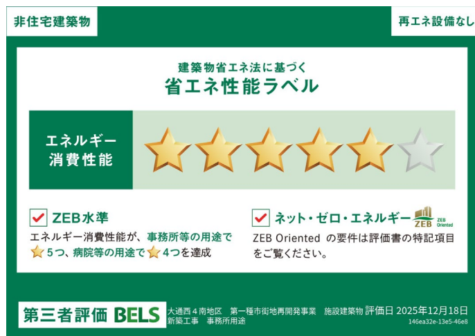
省エネ性能ラベル