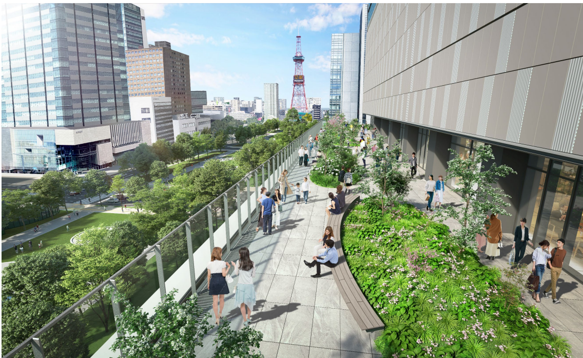
屋外テラスイメージパース