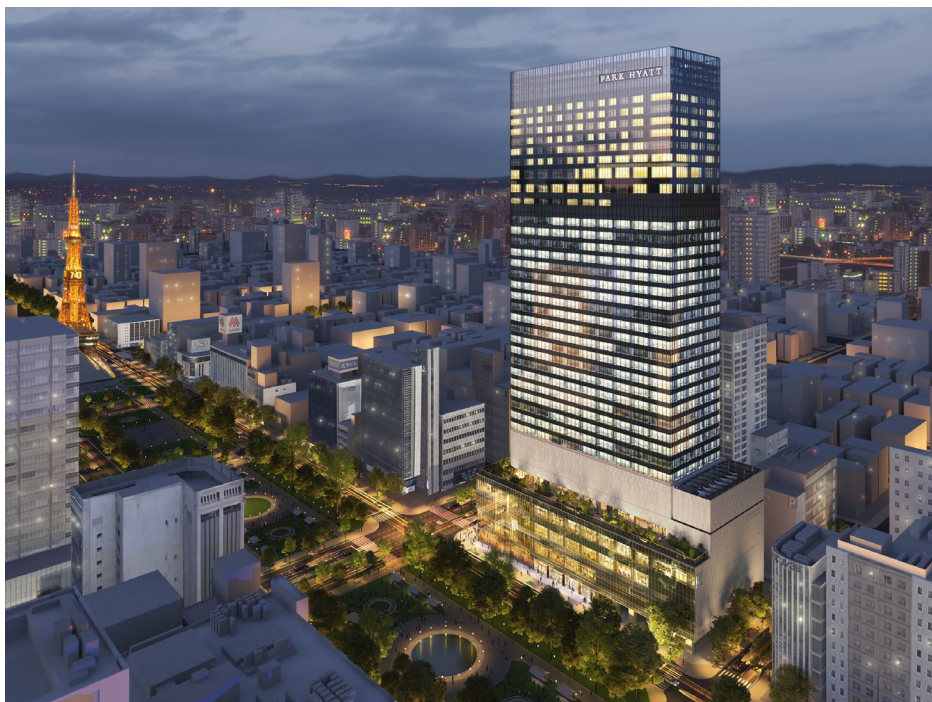
建物外観イメージパース