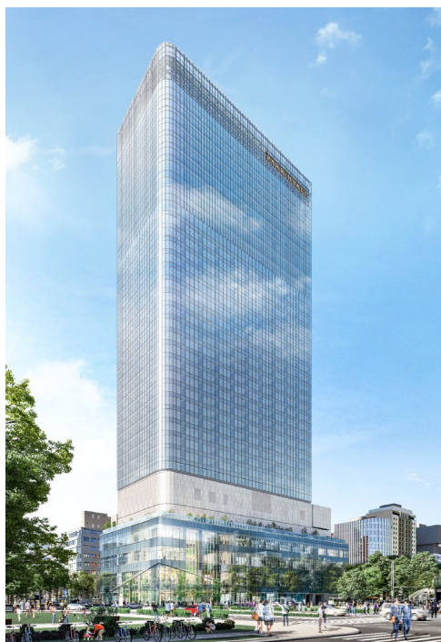
建物外観イメージパース

今後もサステナビリティ経営の実践を充実させることにより、サステナブルな社会の実現に貢献してまいります。