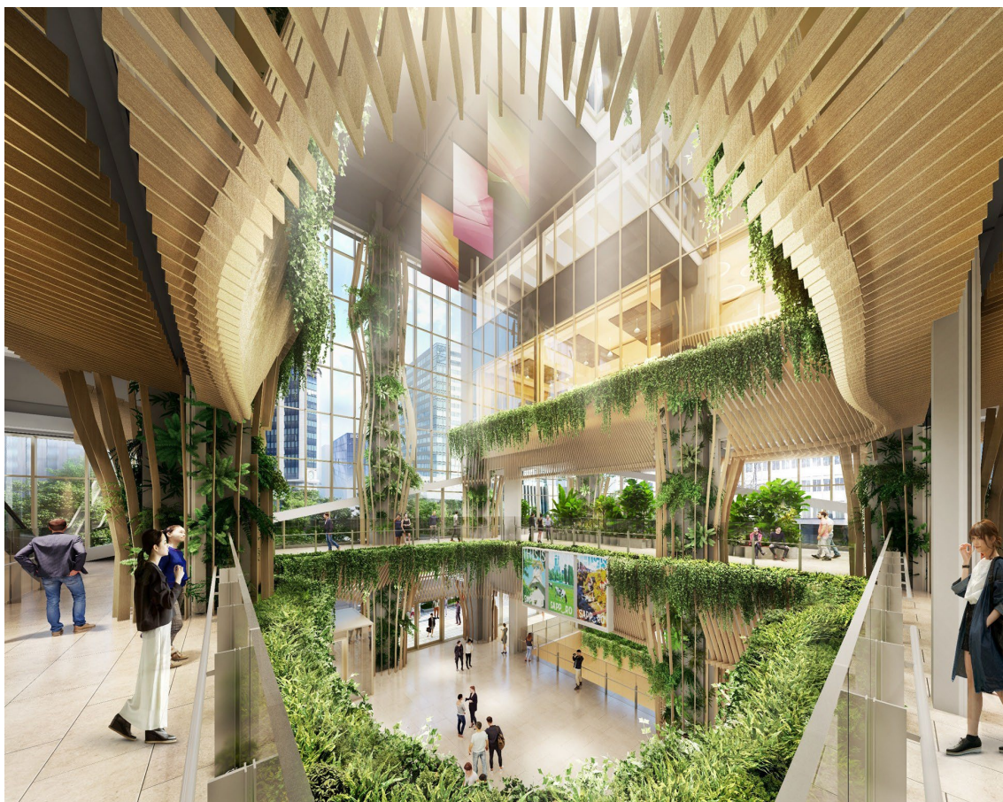
アトリウム内観イメージパース