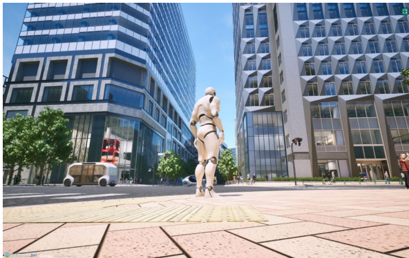
兜町交差点における将来像（昼）※

なお、2024年6月に締結した当社と大成建設株式会社との資本業務提携において、サステナビリティ・DX分野に係る事業分野における業務提携等を推進することとしており、デジタルツイン構築に当たっては、大成建設株式会社の展開する次世代まちづくりツール「シン・デジタルツイン」を活用いたしました。「シン・デジタルツイン」では、高解像度に再現した圧倒的なグラフィックと直感的な操作性、そして、データの可視化から分析シミュレーションまで一貫して可能な機能性を備えており、デジタルツイン上で思いのままに都市や街区の姿を企画・設計できることはもちろん、交通や人流、時間や天気の変化を取り入れた多様な検証を高精度かつスピーディに行うことができます。