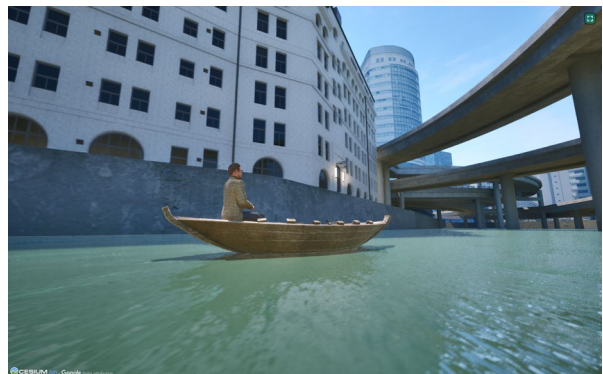
日本橋川から日証館を望む