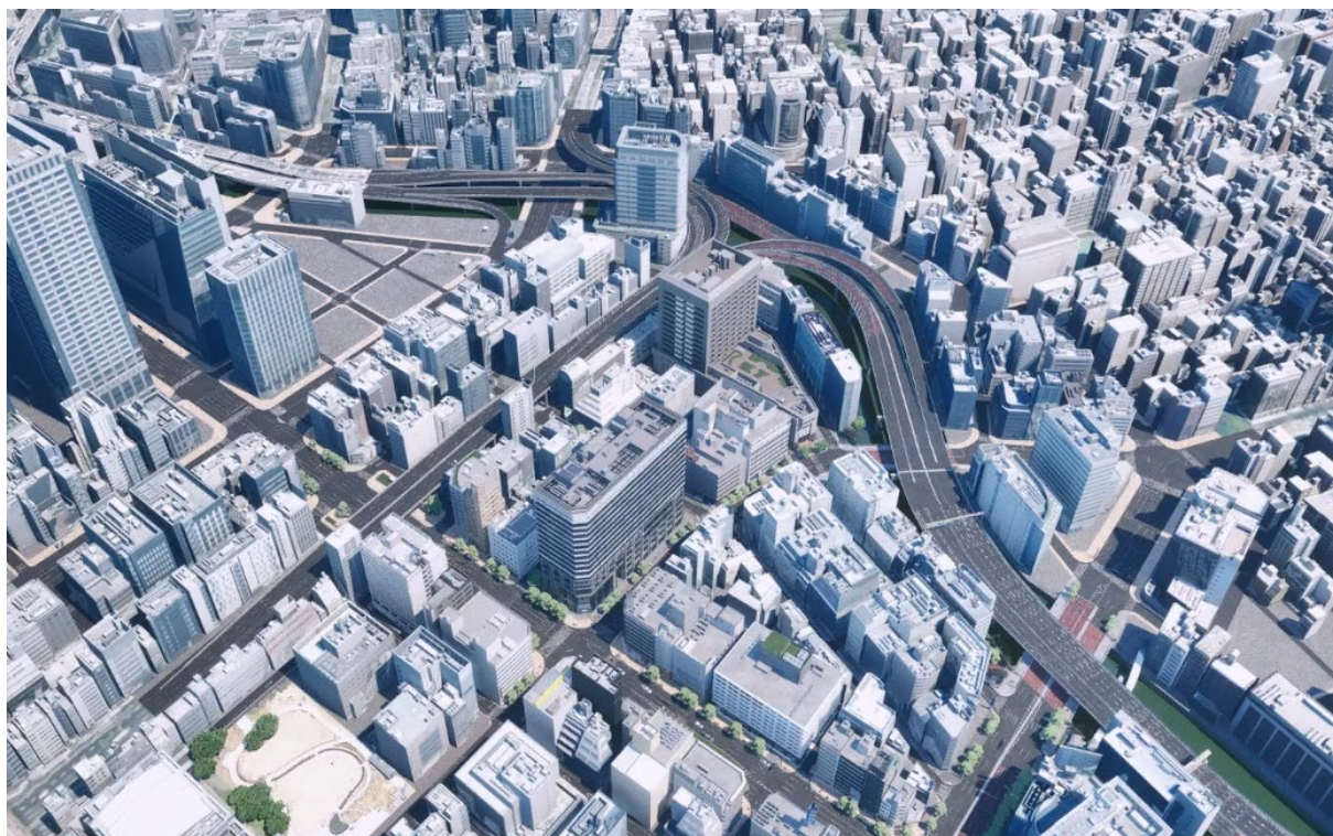
デジタルツイン上で日本橋兜町・茅場町エリアを上空から望む

当社は長期ビジョン「WAY 2040」において「再開発事業の拡大」を成長戦略の一つとしており、日本橋兜町・茅場町街づくりビジョン 2040 では、街のにぎわいを支える基盤の一つに「DX」を掲げております。このDX推進の一環として、日本橋兜町・茅場町エリア一帯のデジタルツイン構築及び活用を推進するものです。