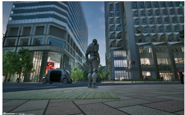
兜町交差点における将来像（夜）※