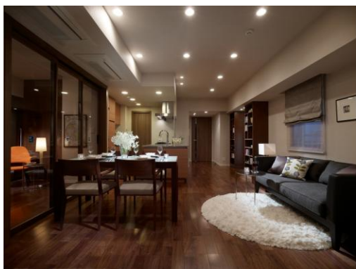
キッチンから家族を見渡せる間取り

「グローリオ蘆花公園」は、住まう人の多様なライフスタイルに対応できるよう、多様なプランを用意していますが、そのライフスタイル提案の1つとして、スペース・オブ・ファイブ株式会社が提唱する「頭のよい子が育つ家」をコンセプトとしたプランを採用しています。「頭のよい子が育つ家」のプランニングはこれまで全国で採用されていますが、都内の集合住宅では「グローリオ蘆花公園」が初の採用となります。