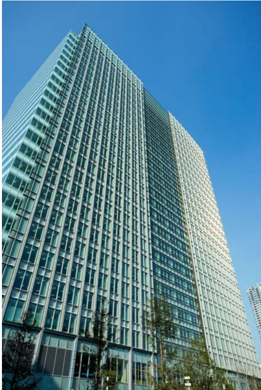
< 建物外観 >