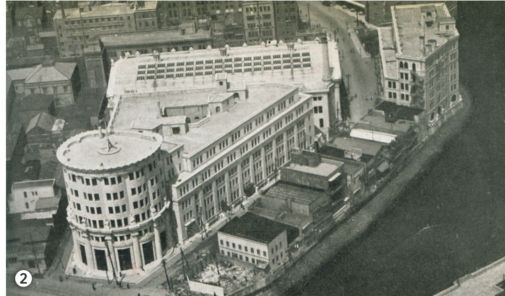
1943 日本証券取引所発足