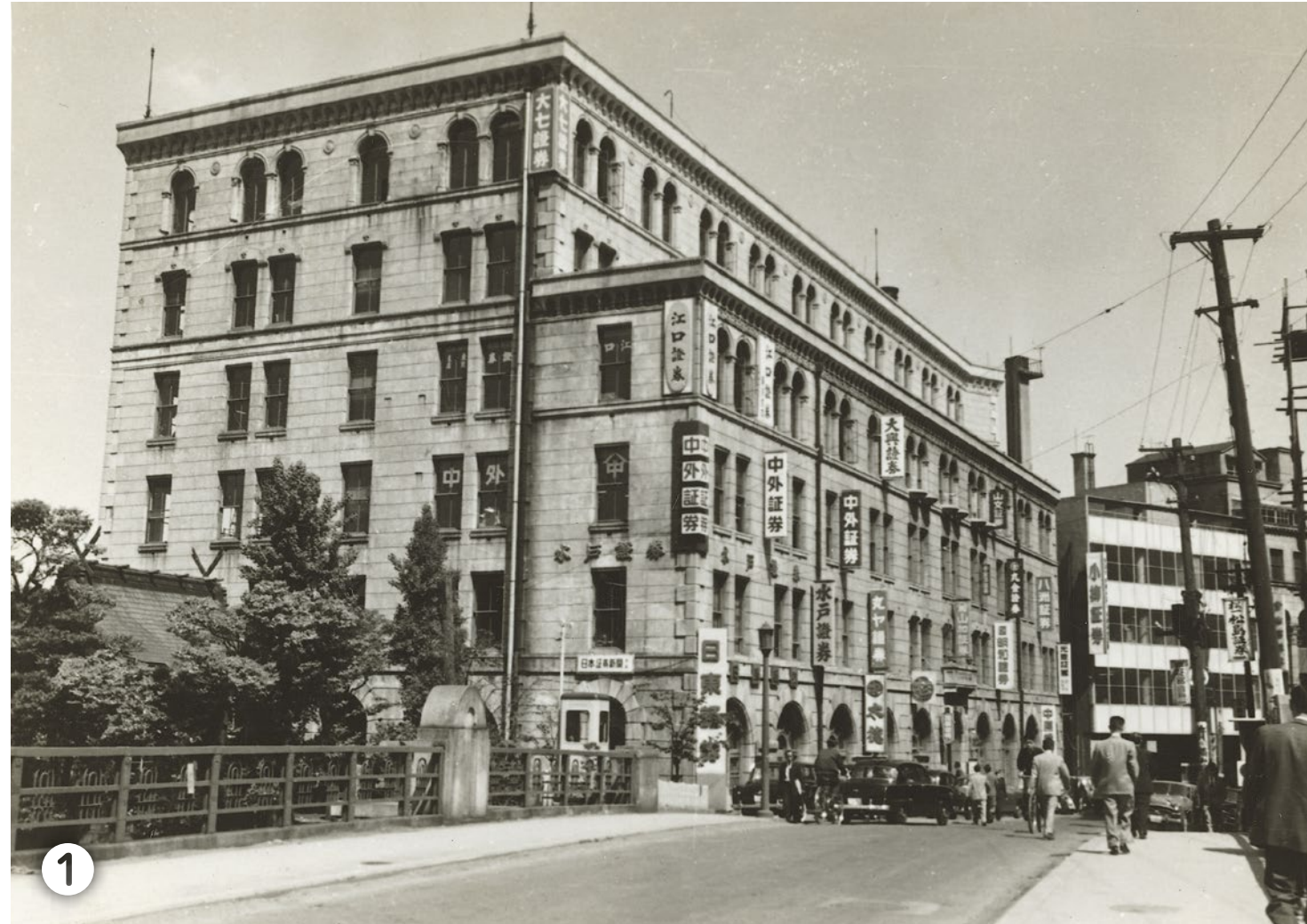
1928 渋谷栄一邸宅跡地に日証館建設